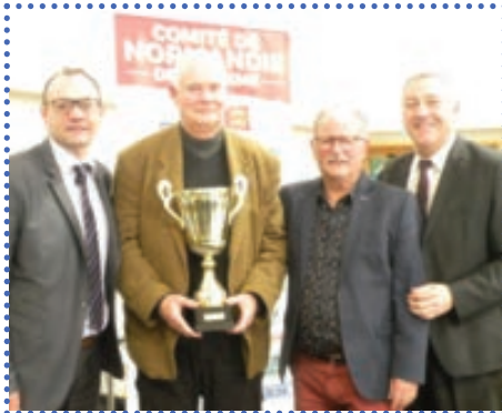
Le club des Pédales Varengevilleaises, Champion d'Europe et Champion de France