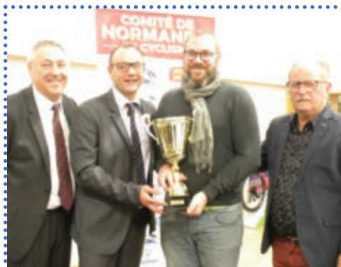
Evreux BMX - 3ème de la Coupe de France de DN1 BMX & Evreux BMX - Plus grand club en nombre de licenciés