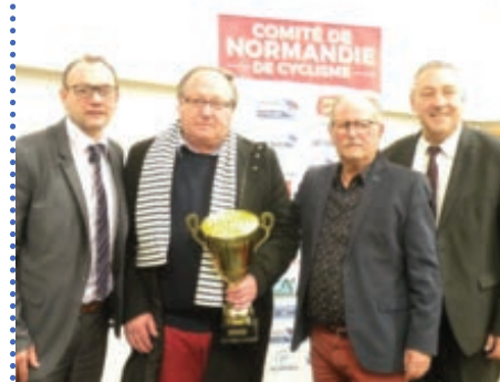
L'ES Torigni 3ème de la Coupe de France de DN3 Route