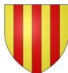
Ville de Foix