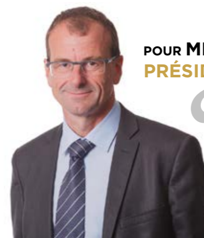
POUR MICHEL CALLOT PRÉSIDENT DE LA FFC

Les Missyclettes représentent des valeurs : la liberté, l'autonomie, le sport, la santé, la douceur, la convivialité, le challenge, le partage. C'est une série d'événements à venir en partenariat avec les opérations nationales liées au cyclisme, aux actions des clubs ou rencontre organisée par la Fédération. Et ce sera, une marque de produits dérivés adaptée aux besoins de la femme et aux tendances de la mode.